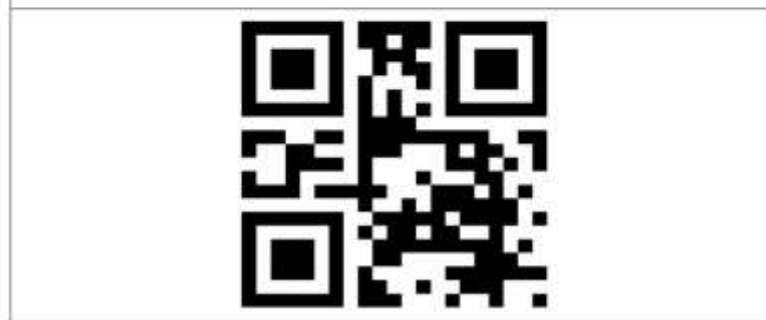
Obrazovka 14 – Certifikát