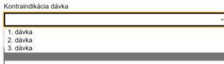
Obrazovka 8 – Vstupný formulár – Kontraindikácia dávka

Ak u pacienta išlo o kontraindikáciu pri 1., 2. alebo 3. dávke označte tento stav výberom z ponuky „Kontraindikácia dávka“ . Je možné vybrať len jednu z ponúkaných možností. Podrobnejšie informácie ku kontraindikácii môžete popísať v políčku „Popis kontraindikácie“.