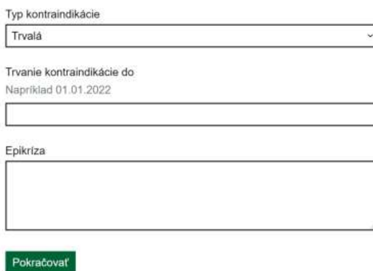
Obrazovka 10 – Vstupný formulár – Typ kontraindikácie a Epikríza

Políčko Epikríza je určená na krátky sumár jednej alebo viacerých diagnóz, na základe ktorých je pacientovi vystavovaný Certifikát o výnimke z očkovania.