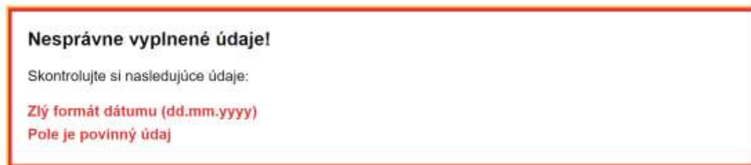
Obrazovka 11 – Vstupný formulár – Nesprávne vyplnené údaje

Pre potvrdenie vypísaných údajov stlačte tlačidlo „Pokračovať“. V prípade, že nie sú uvedené všetky povinné údaje alebo sú v zlom formáte, systém na to upozorní a požiada o nápravu.