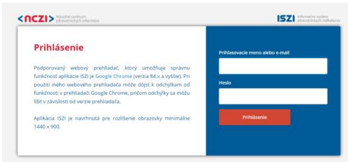
Obrazovka 2 – Prihlasovacia obrazovka

Po stlačení tlačidla Prihlásenie, sa systém presmeruje na prihlasovaciu obrazovku. Prihlasovacie údaje sú rovnaké aké Vám boli pridelené pre prihlasovanie do systému ISZI.